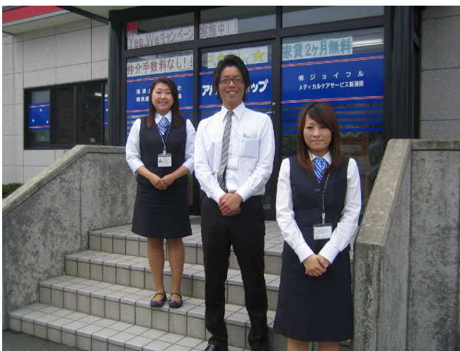
信濃町店スタッフ一同